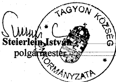
Steierlein István polgármester

A két program között, november végén, december elején lenne célszerű megtartani a faluház átadó ünnepségét. Erre vonatkozóan még egyeztetések szükségesek, át kell gondolniuk a meghívottak körét. Tervei szerint pénteki vagy szombati napon tarthatják meg az átadást, javasolta, hogy a hivatalos átadót követő fogadáson az összes meghívottat lássák majd vendégül. Az átadó kapcsán is szóba került egy rövid műsor megszervezése. Kérte, hogy ezen is gondolkodjanak, egyeztessenek. Ezt követően megköszönte a munkát és a nyilvános ülést 8 00 órakor bezárta.