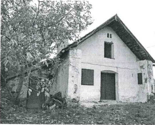
PRÉSHÁZ, 604 HRSZ.

A Tagyon-hegy közepén, a történelmi szőlőhegy aljában áll ez a kétszázthatú, egyszintes, fehérre meszelt pince-préház. A kőből épített pince földdel borított, cseréptető csak a présház felett van. Az épület két oldalfala kb. 1-1,2 méterrel hosszabbra épült a homlokzati falsíknál, és a tetőt is továbbnyújtották az oldalfalakkal együtt. Ez az un. „iszlinges” pinceelőtér eléggé ritka már, és általában a kisebb alapterületű, egy vagy kétszázthatú pincéknél, présházaknál alkalmazták.